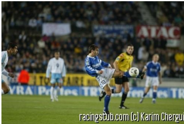
Martins jouera un rôle prépondérant pour le maintien du RCS

☆☆☆☆ (0 note) 📅 27/03/2004 05:15 🏠 Avant-match 🌐 Lu 1.414 fois 👤 Par rachmaninov 🗨️ 0 comm.