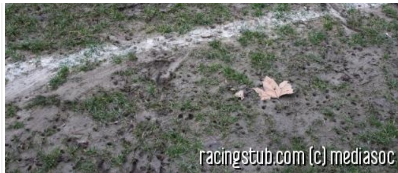
Champ de patates au petit matin.