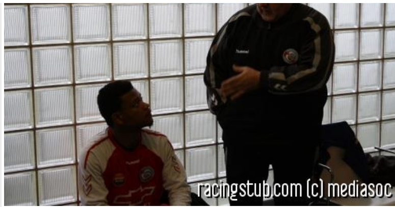
Jean, c'est pas Saïd ; Alan, c'est pas Hicham ; et toi petit bonhomme...

Au match aller en ouverture du championnat Rossfeld s'était imposé 5-1 sur son terrain. Cette fois-ci, après de bons résultats à l'automne et une longue trêve, le coach attend plus de ses joueurs. Avant la rencontre, le RCS est blotti sagement au milieu de tableau avec 6 victoires et 4 défaites au compteur.