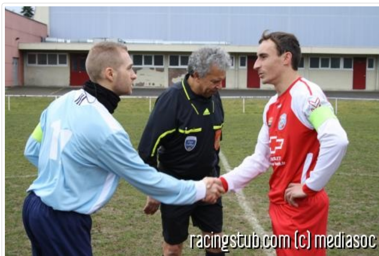
Les capitaines des deux équipes se serrent la main