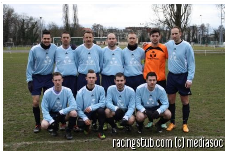
L'équipe de Rossfeld II