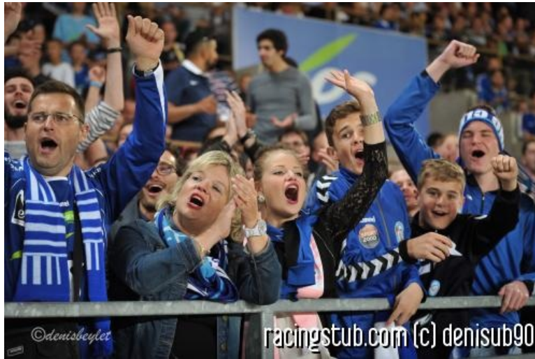
Youpi, l'abécédaire est de retour !

★★★★☆ (3 notes) 📅 04/06/2015 05:00 ↻ Bilan 🕒 Lu 3.216 fois 👤 Par il-vecchio 🗨️ 2 comm.