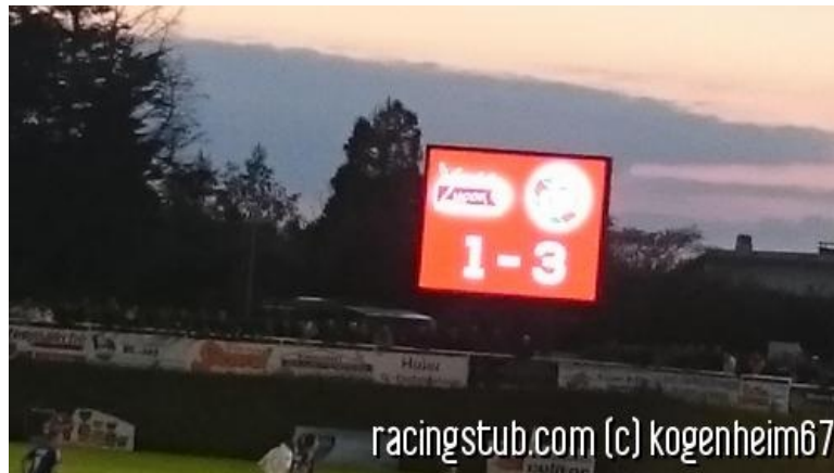
Score sur fond de coucher du soleil

☆☆☆☆ (0 note) 📅 19/06/2015 05:00 📍 Bilan 👁 Lu 2.478 fois 👤 Par mediasoc 💬 0 comm.