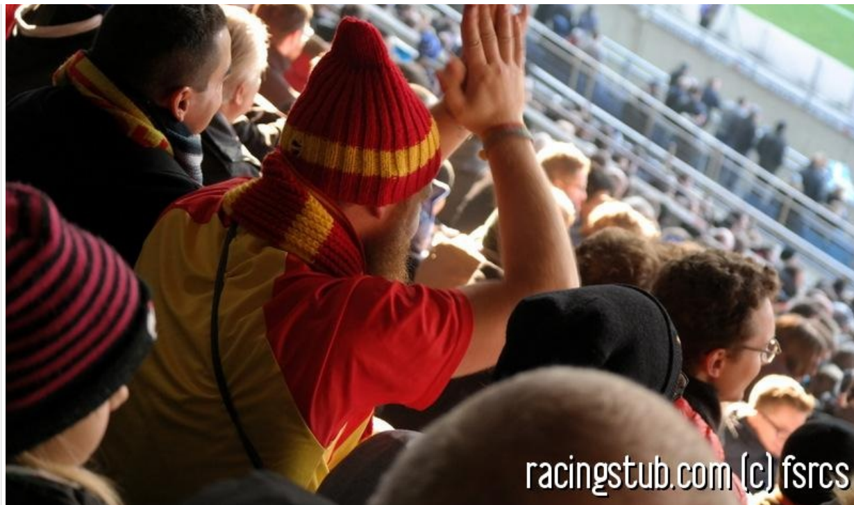
Coustaud s'est réincarné en supporter lensois