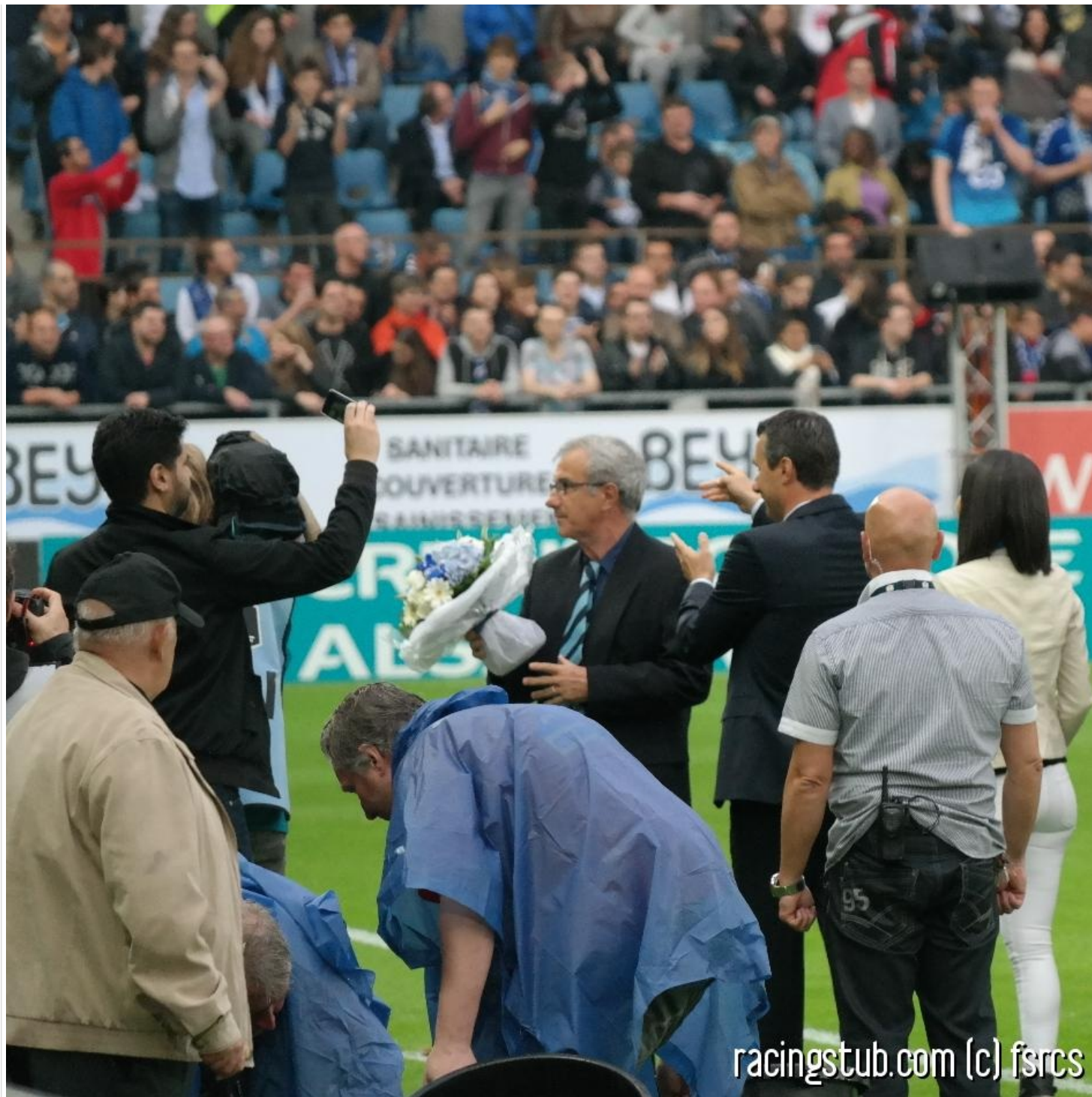
"Eh, Jacky, la sortie, c'est par là !"