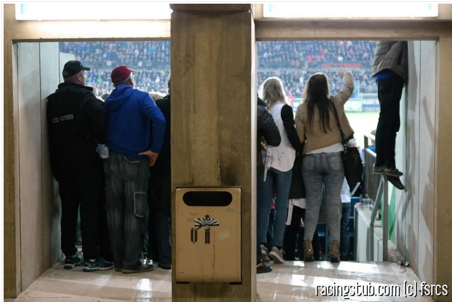
Un enfant, encore innocent, qui ne sait pas encore qu'Amiens va cruellement gâcher la fin de soirée