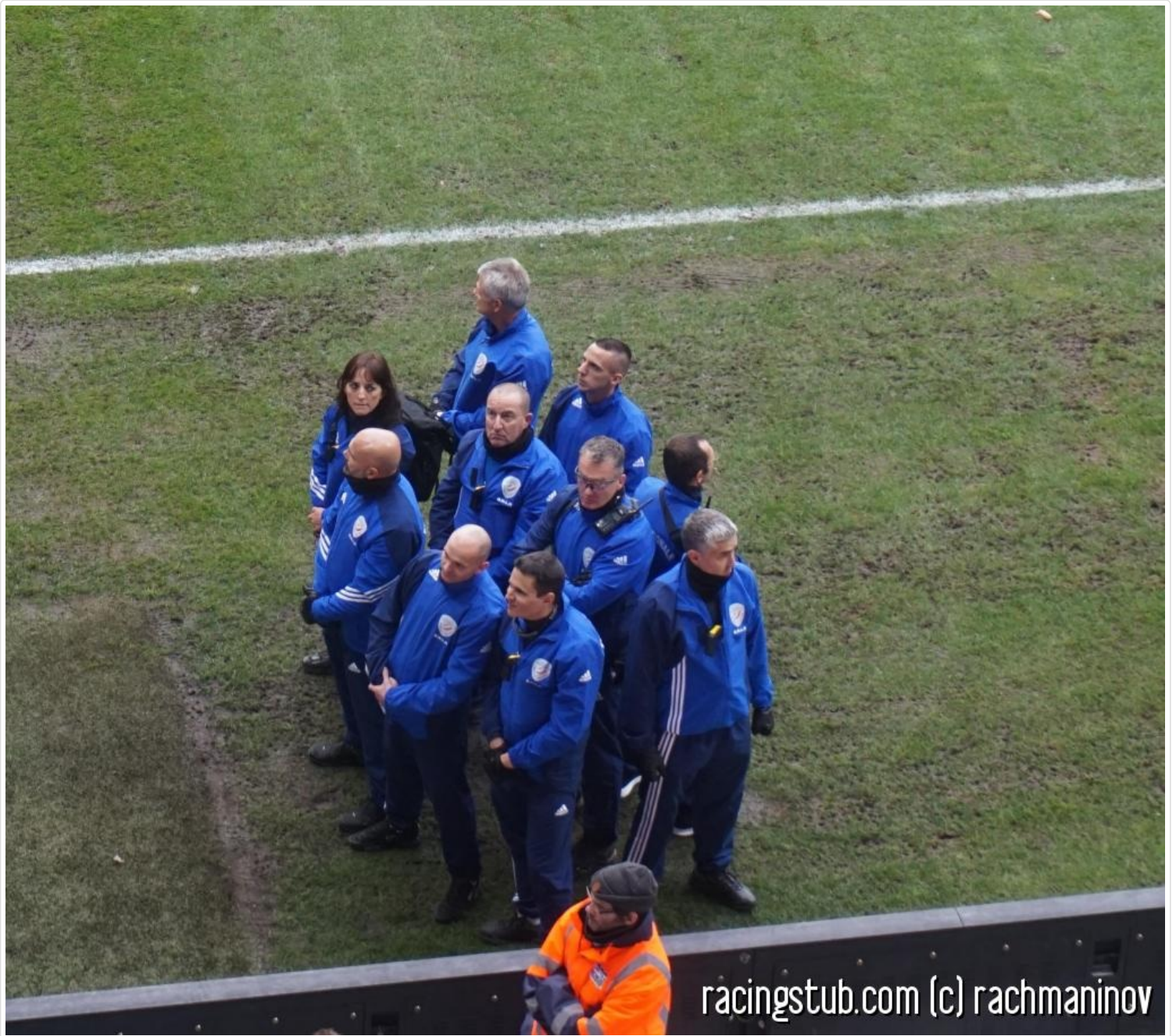
De tristes SIRS