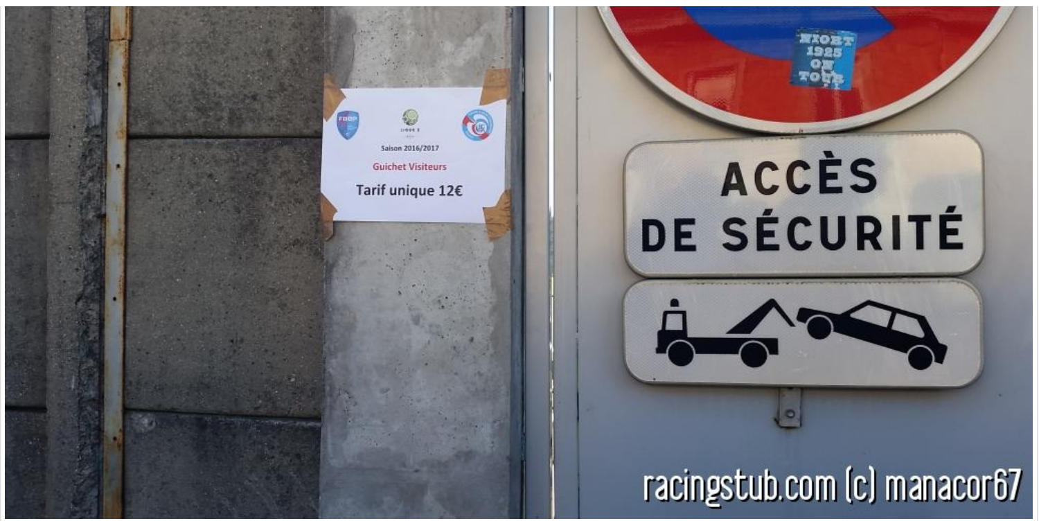
Quel bonheur de retrouver le foot pro, son organisation, ses infrastructures...