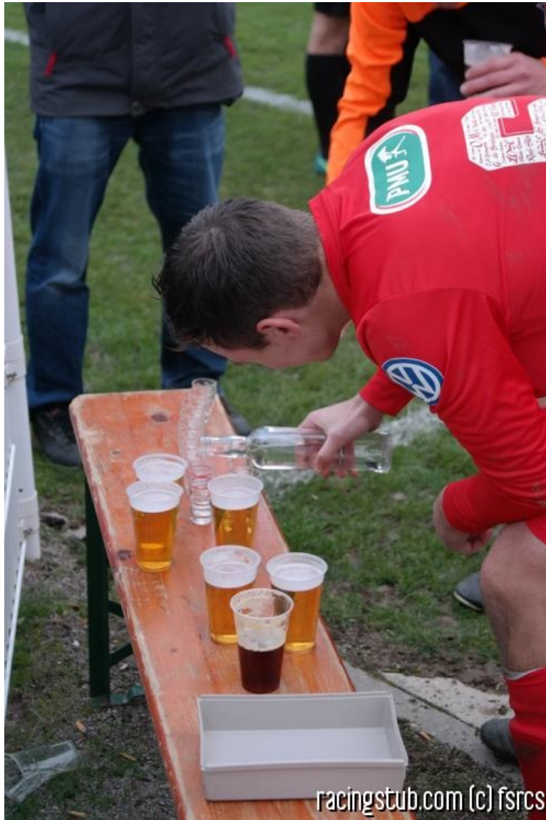
Sortir la tête haute de la Coupe de France, par Oberlauterbach

★★★★★ (2 notes) 📅 29/12/2016 05:00 ↻ Bilan 👁 Lu 3.656 fois 👤 Par rachmaninov 💬 6 comm.