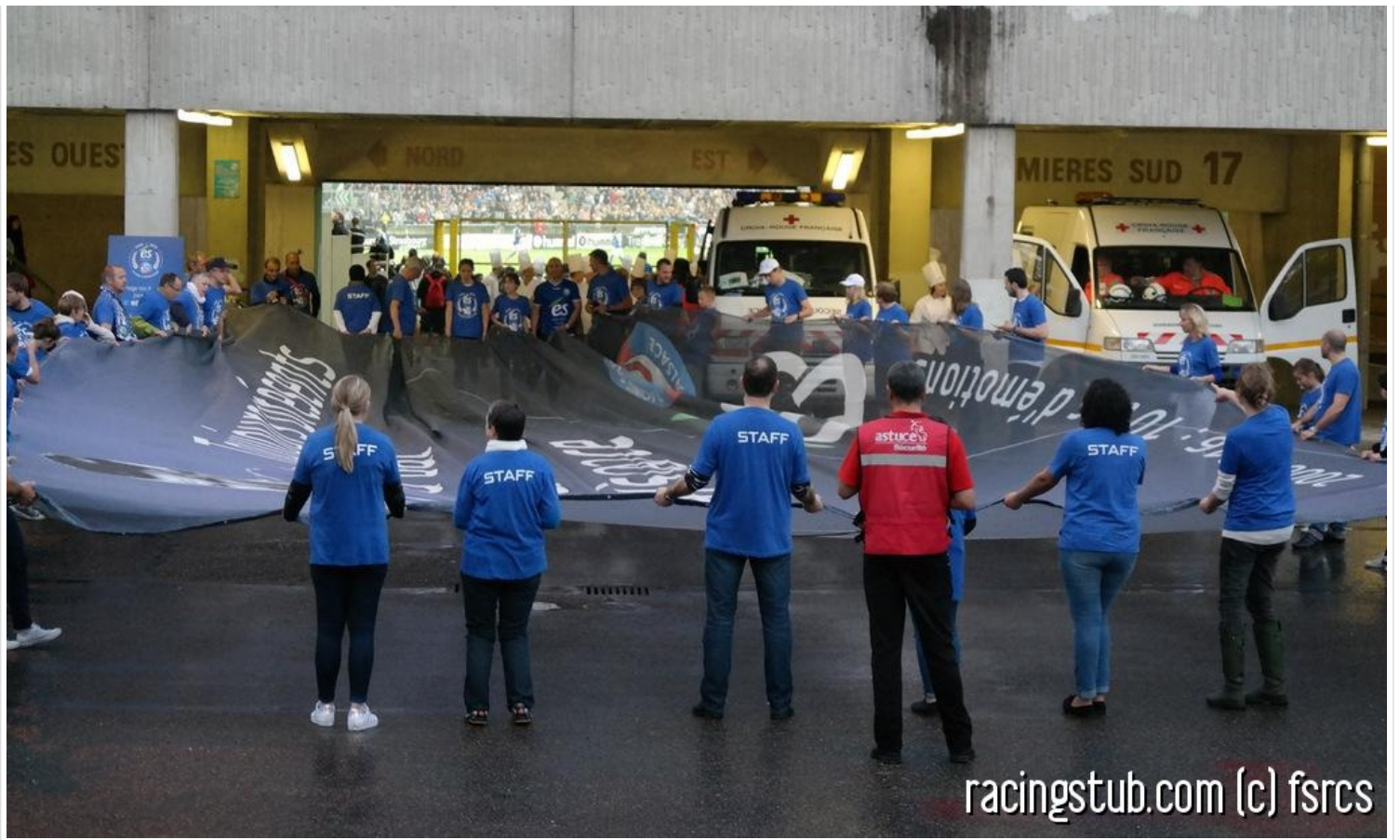
Pour anticiper toute tentative de suicide en cas de défaite du Racing, le club a tout prévu