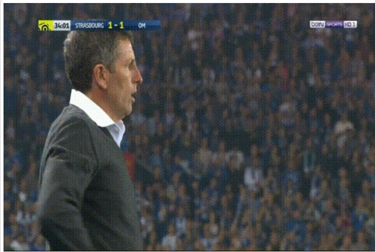
- SEKAAA, au pied !