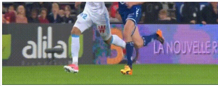
- Sakai, Sakai... mais non, ça caille pas, c'est l'été indien !