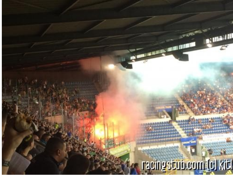
Les fans du Maccabi mettront la pression sur le Racing au match retour

★★★★★ (11 notes) 📅 01/08/2019 05:00 📍 Avant-match 📖 Lu 4.693 fois 👤 Par kitl 🗨️ 10 comm.