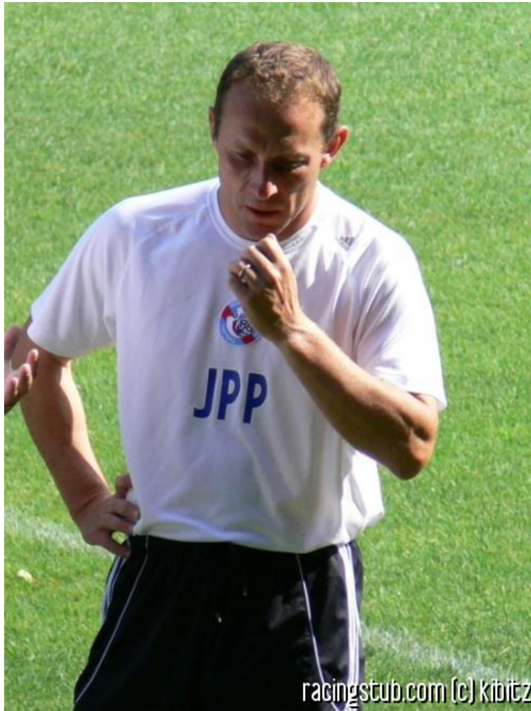
JPP n'aura pas réussi à maintenir Lens en L1

☆☆☆☆ (0 note) 📅 02/07/2008 06:56 📍 Au jour le jour 📖 Lu 2.160 fois 👤 Par superdou 💬 0 comm.