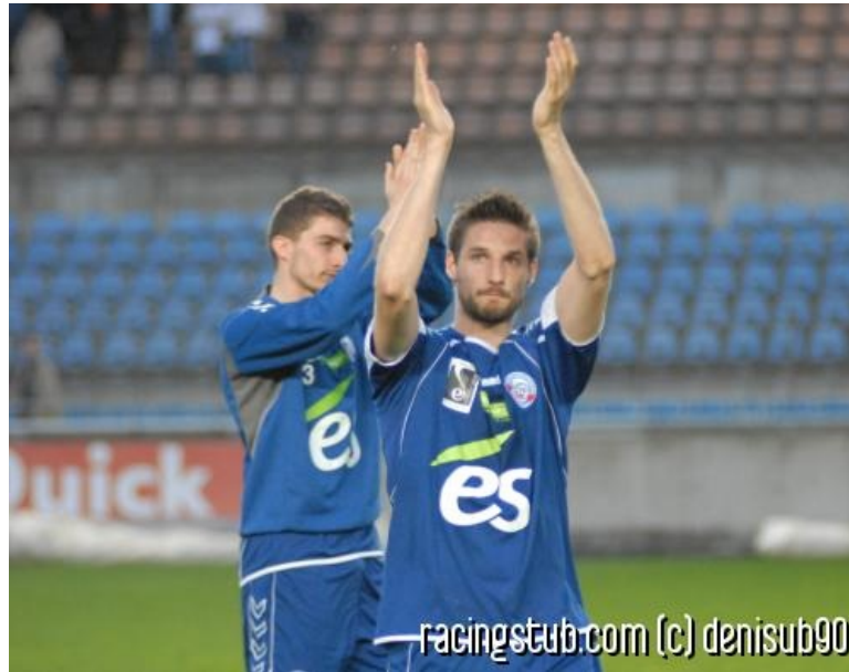
We will rock you

☆☆☆☆ (0 note) 📅 16/04/2011 05:00 🏷 Avant-match 🕒 Lu 1.502 fois 👤 Par stroteam 💬 2 comm.