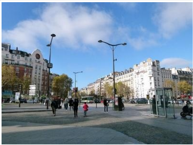
- Ceci n'est pas Orléans. Ceci est l'un des nombreux Non-Orléans.

Orléans. L'affaire de la rumeur d'Orléans. Une légende urbaine à base de traite des Blanches et de vieil antisémitisme probablement conservé dans le vinaigre de l'Occupation, sagement conservée par les miliciens qui ont tué Jean Zay. Les mecs sont tellement antisémites que les juifs sont obligés de se faire passer pour évêque afin d'échapper aux ennuis.