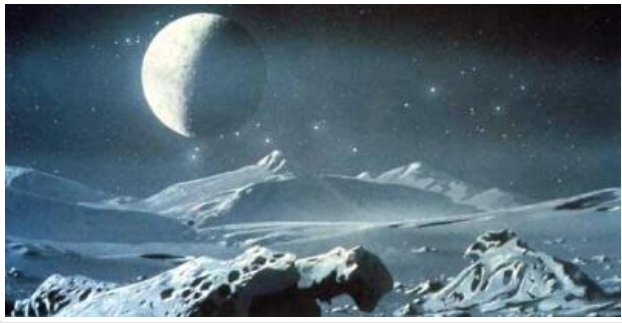
- A mi-chemin entre Orléans et l'infini, Pluton.

Orléans. L'aérotrain. Une expérience qui promettait le progrès, le génie, la ville à vingt minutes de Paris et la gare de Strasbourg à vingt minutes de celle de Vendenheim. Ah non ça c'est déjà le cas, pardon, j'ai dû me méprendre. Un train sur un rail en béton, propulsée par de l'air comprimé. Ça marche pas mal avec des munitions dans un canon, pourquoi pas avec des capsules d'hominidés pressés hein ?