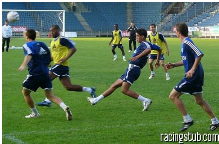
Le RCS s'entraîne sur le terrain du stade Schwarzenegger

☆☆☆☆ (0 note) 📅 15/09/2005 05:00 🏏 Avant-match 🌐 Lu 1.266 fois 👤 Par superdou 🗨️ 0 comm.