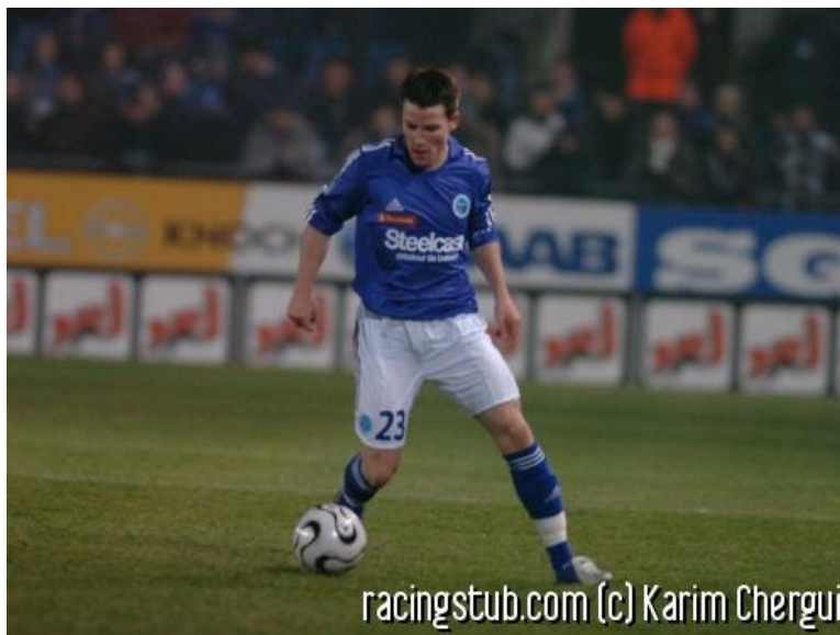
Gameiro devrait être titulaire ce soir

☆☆☆☆ (0 note) 📅 13/04/2007 08:10 📍 Avant-match 🌐 Lu 1.614 fois 👤 Par athor 🗨️ 0 comm.