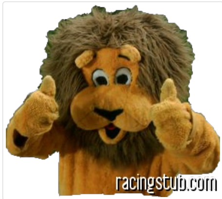
Sochalion, la bébéte Sochaux

( NDLR : cet article fait partie d'une série d'articles au ton décalé et résolument second degré. A lire avec précaution. :baillements: Si tu es professeur de géographie, le courrier est à adresser à Redaction , en te remerciant. )