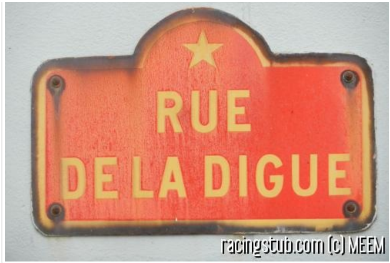
Sochaux, si près de Dunkerque, de Nantes et de Montaigu

Sochaux présente tant de similitudes avec Dunkerque que je peine à savoir par où commencer. Sans doute par le début, mais il y a tant de débuts qu'on s'y perd à la fin. Un peu comme lorsqu'il faut démêler ces enchevêtrements de traits qu'on nomme parfois, dans l'une comme dans l'autre cité, « arbre généalogique ». Ne laissons pas aux Lensois ou à qui vous savez le monopole sur les arbres généalogiques compliqués. Ni aux Mulhousiens la joie de l'usinage automobile (même à toi, iuliu68 ). Ni aux marins la manie de faire des phrases.