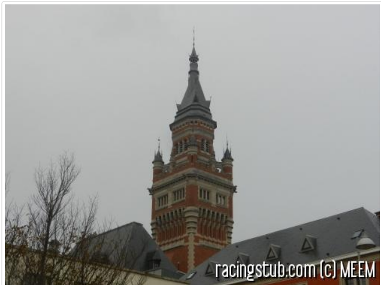
Le ciel parfaitement dégagé de Sochkerque