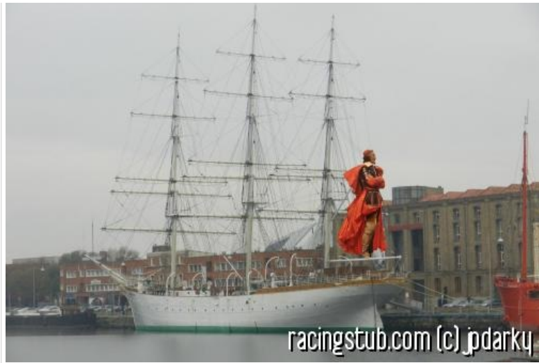
Richelieu en plein trip au LSD se prenant pour une mouette sur la

vergue d'un fameux trois-mâts amarré dans la fameuse rade de Luçon qui ressemble beaucoup à celle de Dunkerque