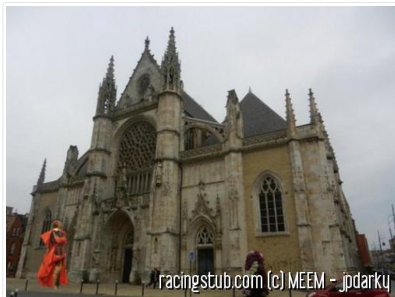
L'église Saint Éloi de Dunkerque, dont l'usage est assez proche

Une petite voix criarde me rappelle que je dois parler de Luçon. Vous pensez que je peux lui répondre "mais justement, je ne parle que de ça" ? Ça me désole, parce que j'avais encore envie de parler de Dunkerque, unique objet de mon désir.