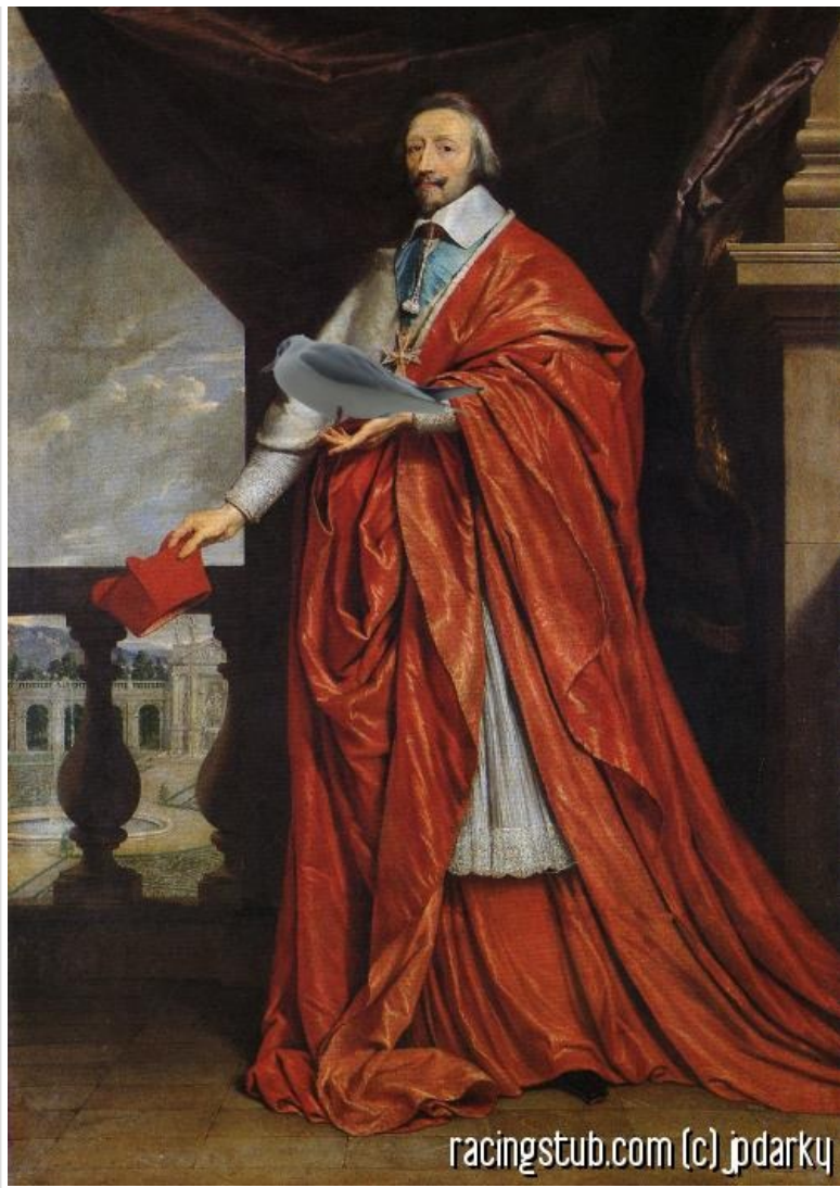
Richelieu, héros luçonnais, dans le fameux portrait "A la mouette