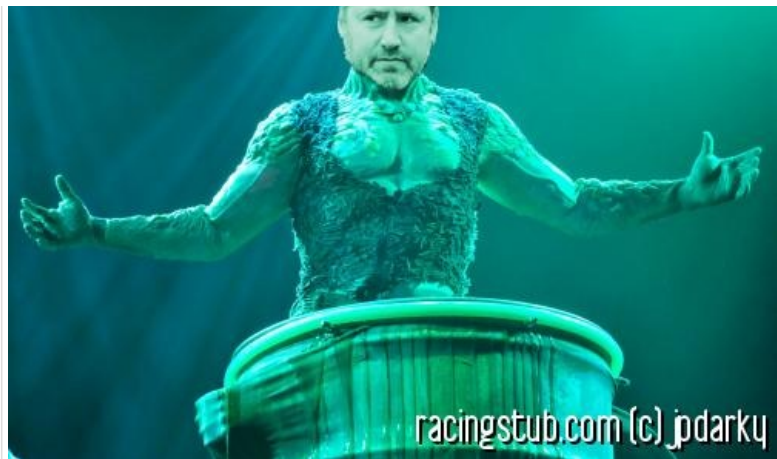
Toxic Sechet Avenger !