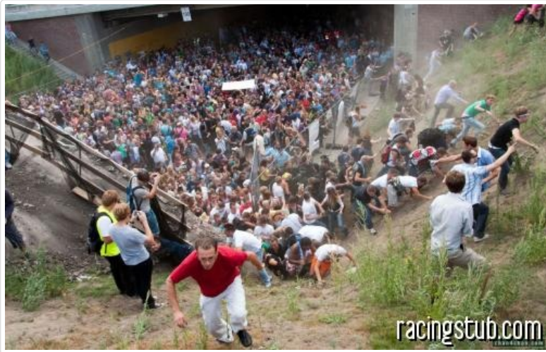
Pire que l'ouverture du Burger King, les scènes de panique après

Les assauts surnaturels invoqués par Conan . La un Romulo enflammé pyrolyse les caisses, ici un Mario Haas sous forme de Struener géant engloutit les pauvres supporters passant à sa portée dans de la purée de pomme brûlant des feux de l'Enfer, etc. Tout n'est que terreur et désolation.