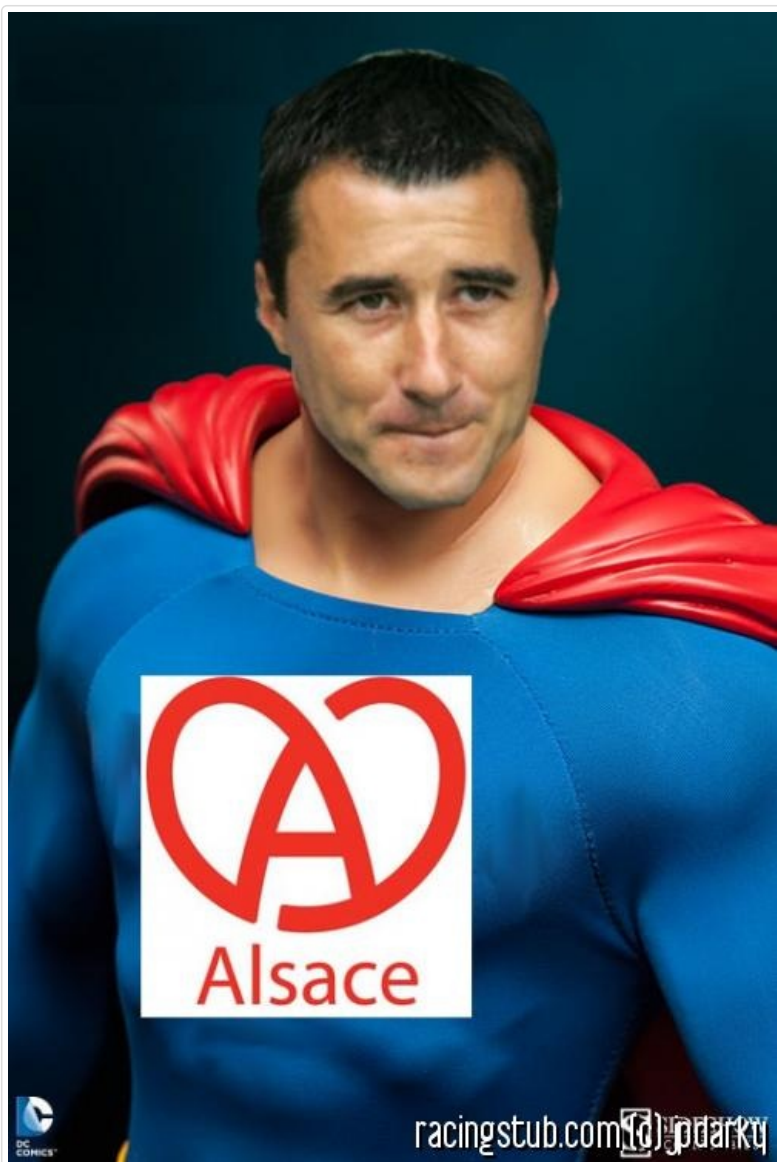
KellerMan, plus qu'un quai, c'est notre super-héros, tenez vous