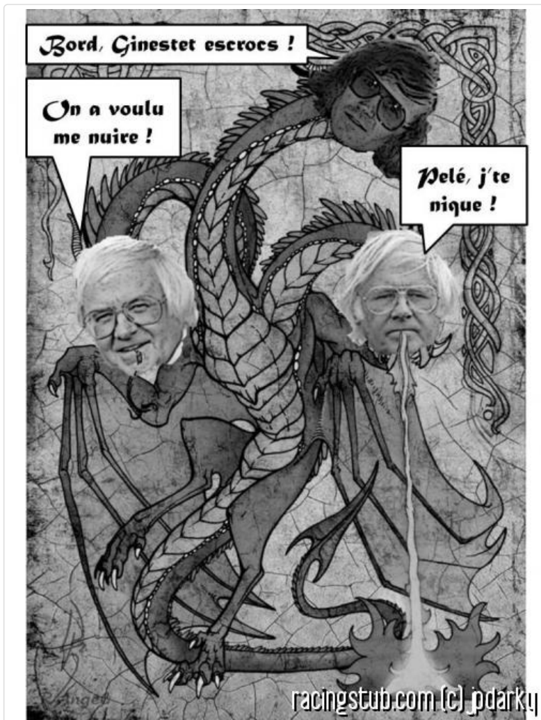
L'Hydre Gress est de retour, et il n'est pas content.

C'est alors qu'une créature cauchemardesque se matérialise sous les incantations impies de Conan sur le parking Couffignal. Un golgoth ? Un kaiju ? Un monstroplante ? Pire ! C'est une hydre, par définition polycéphale, qui sème la mort en hurlant des imprécations rageuses et grotesques à la fois.