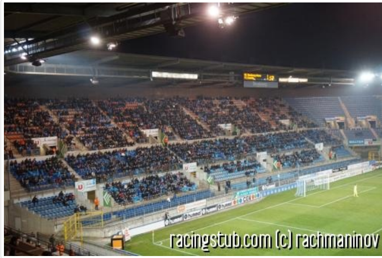
La tribune Est, ouverte pour l'occasion

regroupés en tribune Est), sans que cela ne provoque d'embouteillage aux entrées. Le système de roue semble maintenant bien rodé, le Racing sera prêt pour la seconde division. Le pénalty légèrement décalé dans le temps mais annoncé en avant première par un célèbre stubiste, vient confirmer la bonne forme du public strasbourgeois à défaut d'emballer un match laborieux.