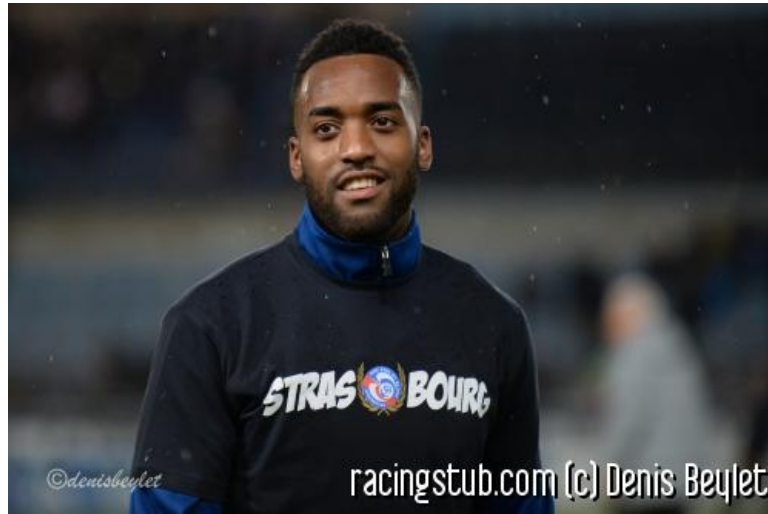
Salmier de retour dans le onze

★★★★★ (1 note) 📅 15/04/2016 05:00 🏏 Avant-match 🌐 Lu 1.832 fois 👤 Par athor 🗨️ 0 comm.