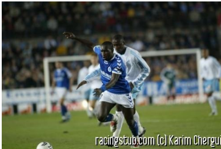
Le retour de Niang est très attendu

☆☆☆☆ (0 note) 📅 14/08/2004 11:31 🏷 Avant-match 🌐 Lu 1.069 fois 👤 Par superdou 🗨 0 comm.