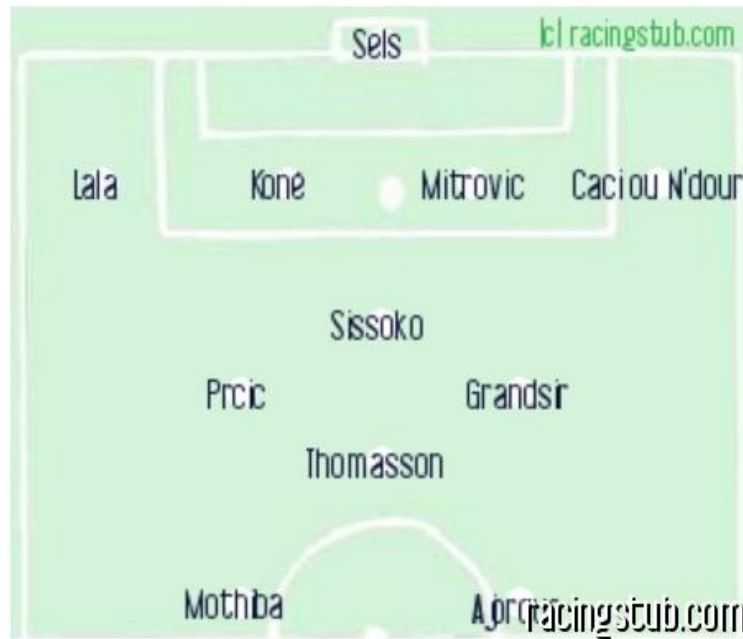
La composition probable du Racing

★★★★★ (2 notes) 📅 03/03/2019 05:00 ↻ Avant-match 👁 Lu 3.299 fois 👤 Par gabmey87 🗨 4 comm.