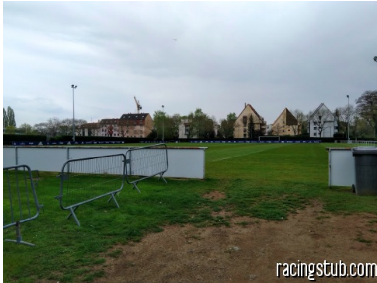
L'un des terrains d'entraînement actuels

★★★★★ (9 notes) 📅 17/04/2019 05:00 ↻ Au jour le jour 🕒 Lu 11.521 fois 👤 Par rédaction 💬 8 comm.