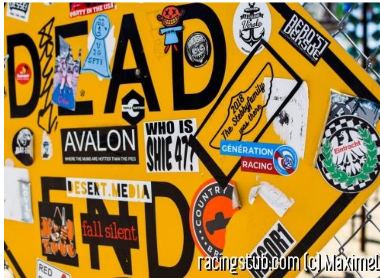
Autocollants du RCS et de Francfort sur un panneau de la route 66