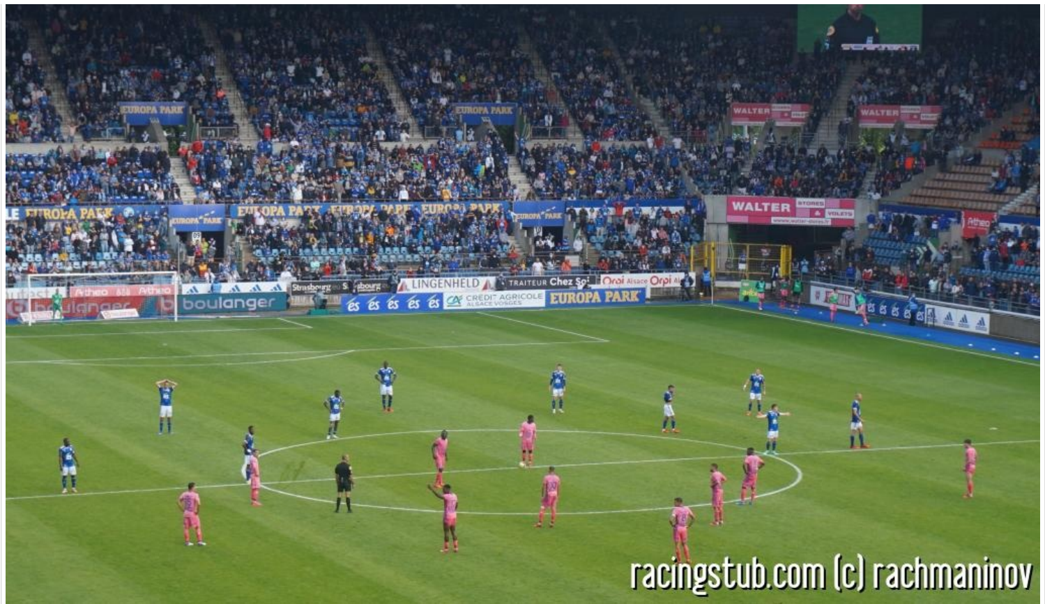
L'attente avant la validation du but du Racing