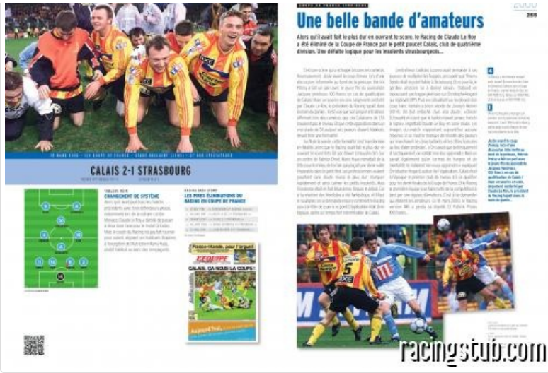
La double page consacrée au match de coupe de France contre Calais en 2000.

Dans les interviews que tu as faites, tu demandes à chaque fois la définition du mot légende. Et pour toi, c'est quoi une légende du Racing ?