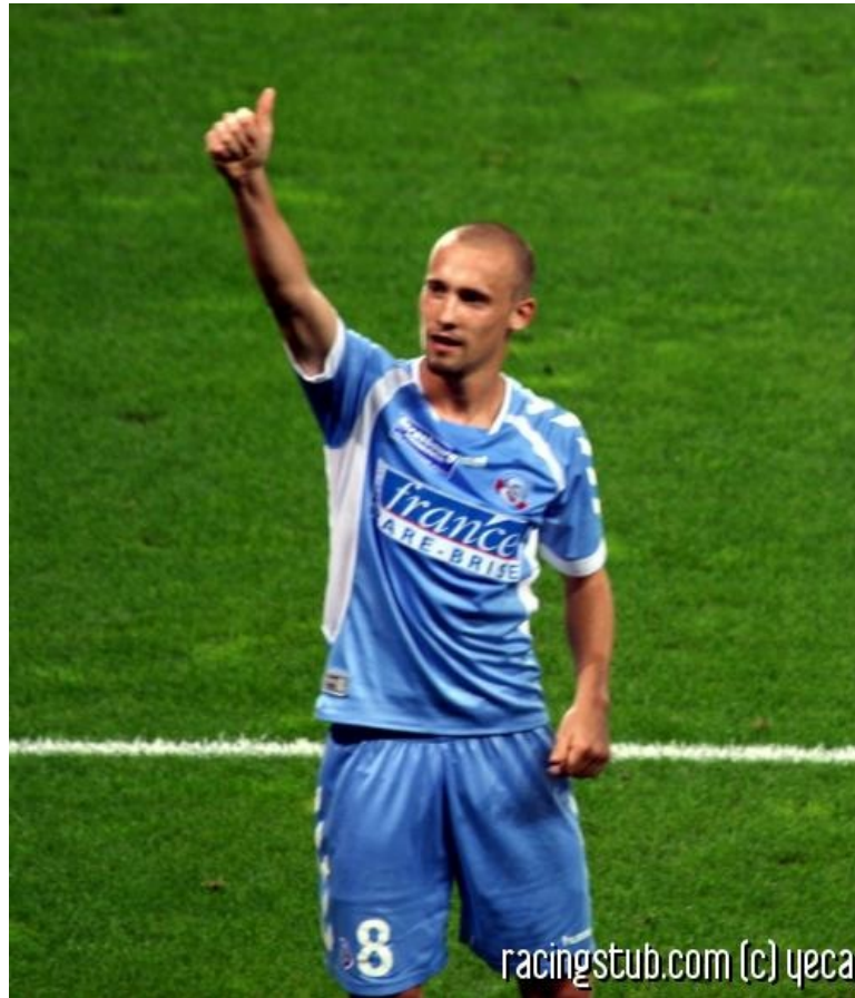
Cohade et le Racing: un point à Lens

★★★★★ (0 note) 📅 27/01/2008 08:27 📍 Après-match 👁 Lu 1.618 fois 👤 Par athor 🗨 0 comm.