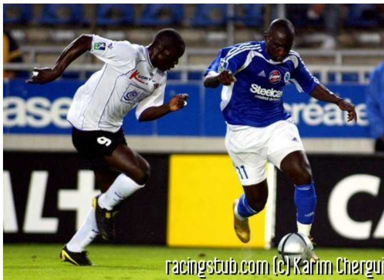
Niang s'est battu, a galéré et a marqué

☆☆☆☆ (0 note) 📅 16/10/2004 22:50 🏠 Après-match 🌐 Lu 968 fois 👤 Par superdou 💬 0 comm.