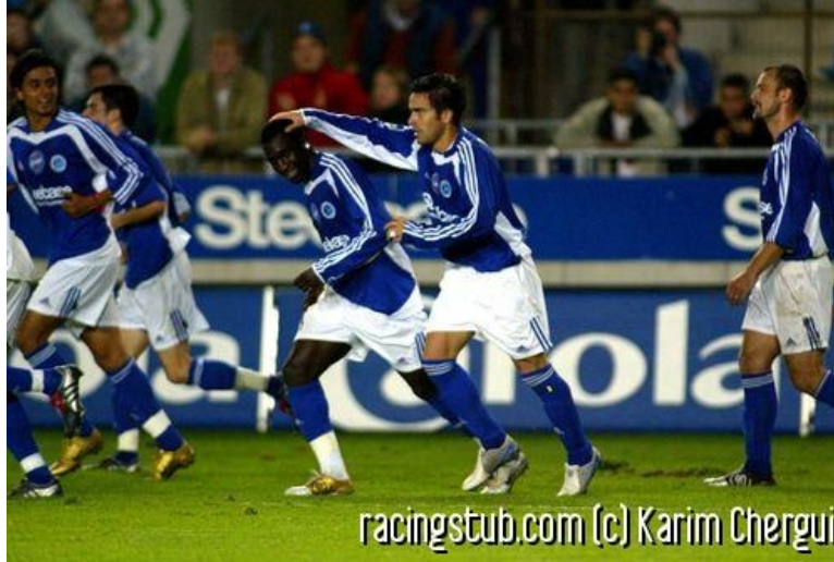
Un Racing victorieux et solidaire, voici ce qui est attendu

☆☆☆☆ (0 note) 📅 06/11/2004 05:02 📍 Avant-match 🕒 Lu 1.099 fois 👤 Par superdou 🗨️ 0 comm.