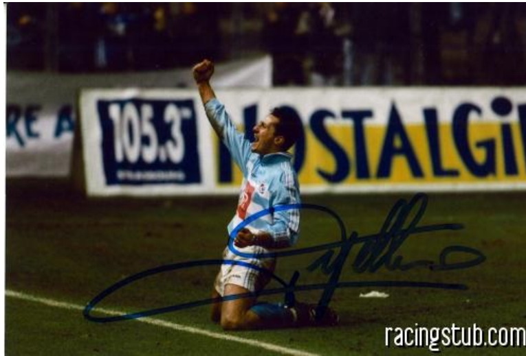
Zitelli-Nostalgie... tout est dit !

☆☆☆☆☆ (0 note) 📅 06/03/2010 00:55 📍 Au jour le jour 🕒 Lu 4.576 fois 👤 Par rédaction 💬 9 comm.