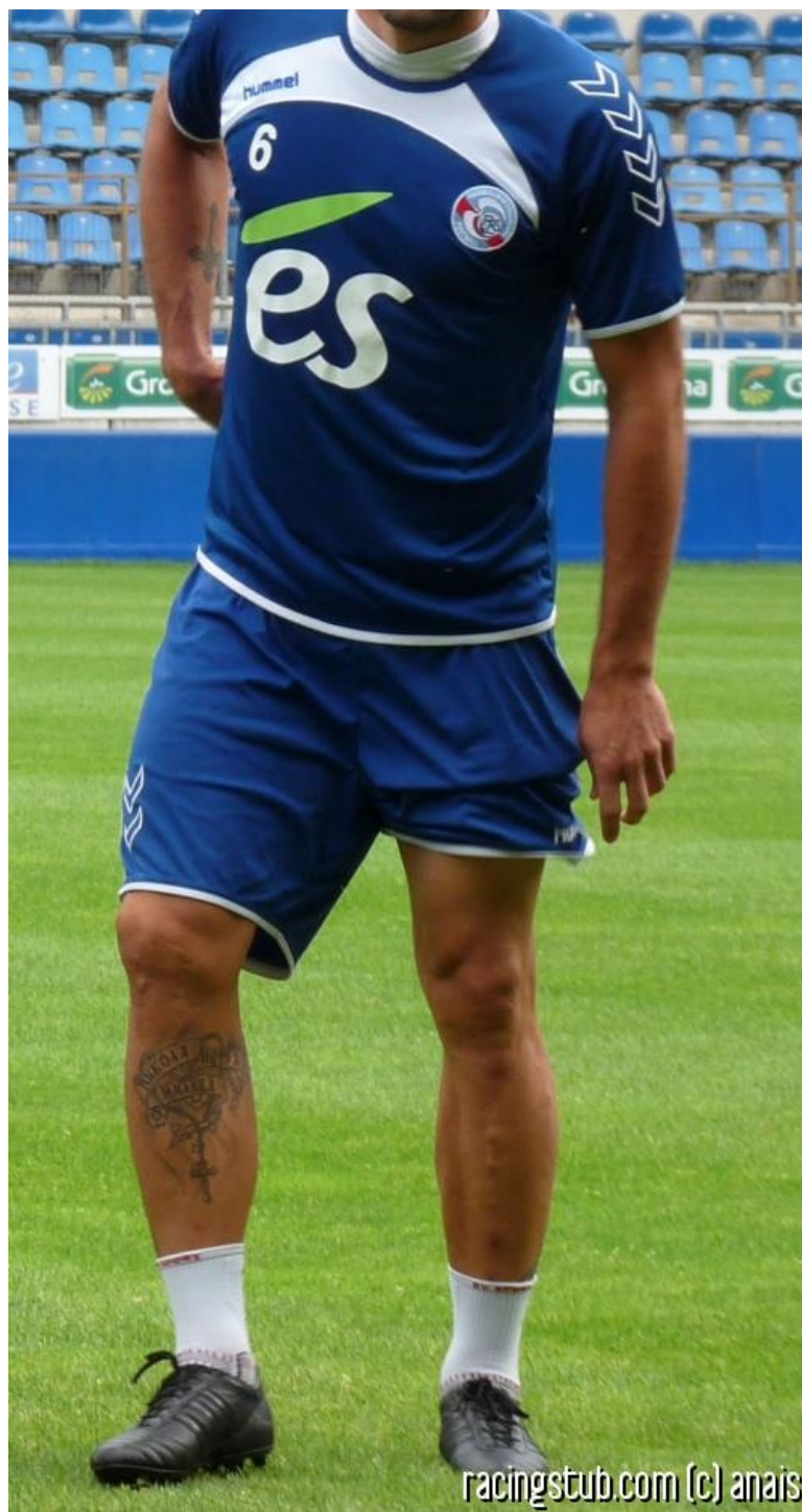
Saint Milo de retour au temple

L'En Avant revisite le National cette année, un niveau quitté il y a 16 ans. Un borbier dont il espère très vite s'extirper, tout comme son hôte alsacien. Vous avez dit choc ? Alex le Guingampais va plus loin et parle même de Ligue 1 !