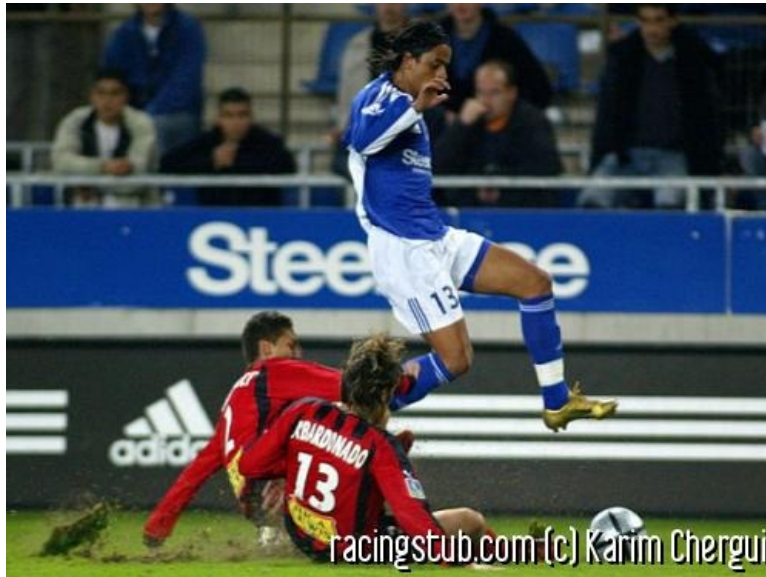
A l'aller Arrache affolait les Niçois. Les choses ont changé depuis.

☆☆☆☆ (0 note) 📅 10/03/2005 05:02 📍 Avant-match 🕒 Lu 1.074 fois 👤 Par rachmaninov 🗨️ 0 comm.